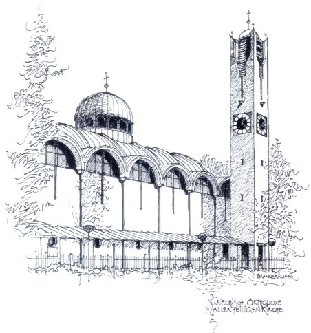
Ενορία Αγίων Πάντων