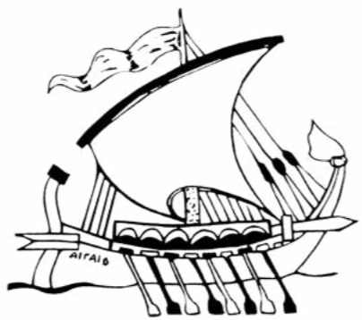
Σύλλογος Αγίου Μονάχου Ägäisverein München e.v.